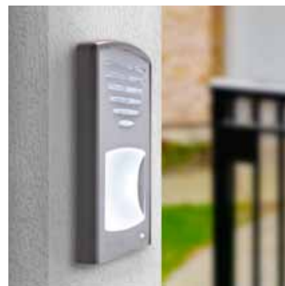
Click à encastrement avec 1 bouton d'appel (94 x 150 x 17 mm)