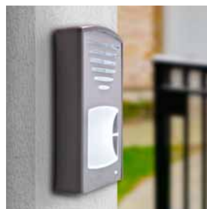
Click en saillie avec 2 boutons d'appel (94 x 150 x 28 mm)